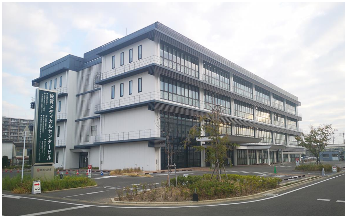
佐賀メディカルセンタービル