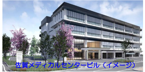
佐賀メディカルセンタービル（イメージ）

今年度の年末年始には引越し作業を予定しておりますが、集配体制は例年通りに対応します。